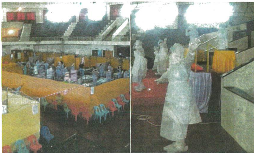
Klip video menunjukkan petugas kesihatan menyanyi dan menari dengan memakai PPE bagi menghiburkan pesakit COVID-19 di Penampang tular di media sosial.

Dr Leydra berkata, aktiviti itu akan disesuaikan di setiap pusat kuarantin, bergantung pada keluasan pusat berkenaan bagi men-