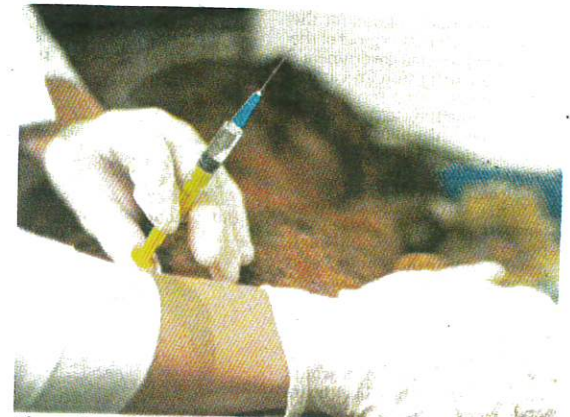
Those with pet dogs are advised to send them for a yearly rabies shot at the nearest veterinary clinic.

"Make sure pet dogs get their yearly rabies shot at the nearest veterinary clinic, keep them away from other stray dogs or animals,