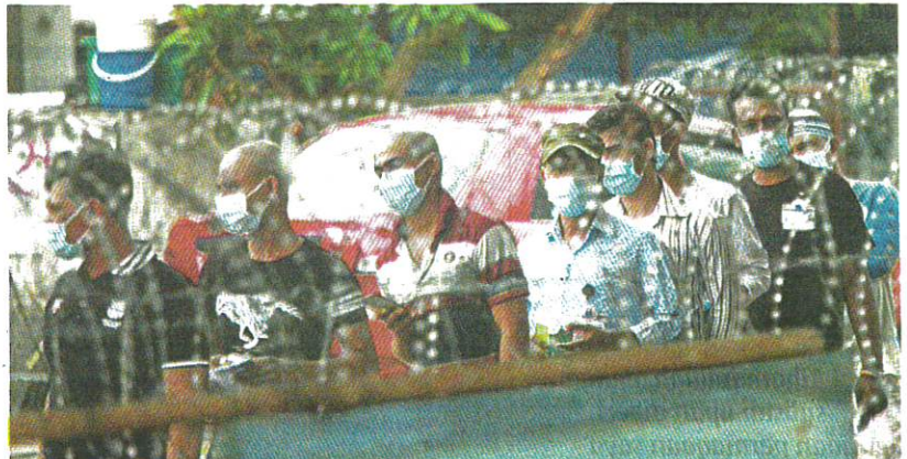
Pekerja syarikat sarung tangan Top Glove menjalani saringan COVID-19 susulan Perintah Kawalan Pergerakan Diperketatkan (PKPD) di asrama pekerja wanita di Meru.

ta terabit akan menjawab soalan berkenaan. Ada antara 10 hingga 12 syarikat sudah menjalankan fasa ketiga ujian klinikal yang datanya belum diterbitkan lagi.