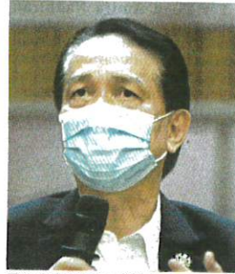
Tan Sri Dr Noor Hisham Abdullah

The testing rate in Malaysia, he said, was relatively higher than in